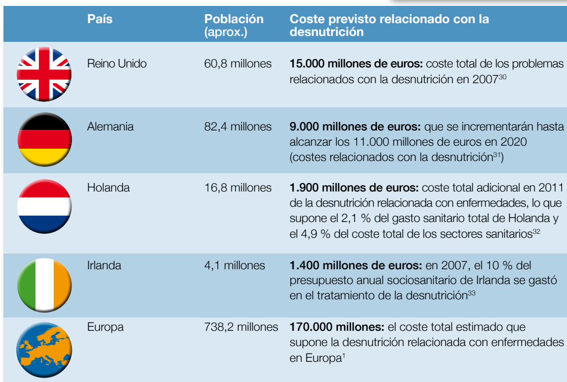
Tabla 1 Ejemplos de los costes estimados de la desnutrición en toda Europa