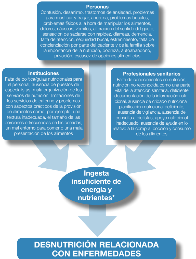
Figura 2 Factores que generan una ingesta insuficiente de energía y nutrientes en adultos como consecuencia de un problema de desnutrición relacionado con enfermedades (adaptada a partir de Stratton et al. 2003) 2

Pero, además de la ingesta insuficiente de alimentos, la desnutrición se debe a muchos otros factores (fig 2). La falta de una descripción clara con respecto a las responsabilidades de las autoridades sanitarias, las instituciones y los profesionales sanitarios, así como una formación insuficiente y escasez de equipamientos para el cribado nutricional, agravan el problema de la desnutrición. Así pues, es necesario un planteamiento o enfoque multidisciplinar con el que identificar y poner en marcha soluciones adecuadas y efectivas al respecto.