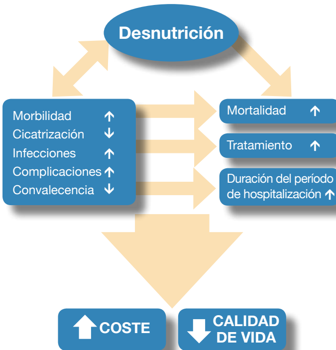
Figura 3 Pronóstico del impacto de la desnutrición (adaptada a partir de Norman et al. 2008) 27

A su vez, la desnutrición puede suponer consecuencias negativas para los presupuestos sanitarios nacionales dado que se produce un aumento del uso de los recursos sanitarios tales como el incremento de la duración del período de hospitalización y el incremento de las rehospitalizaciones. La duración del período de hospitalización puede incrementarse, una media, de 30 % en el caso de los pacientes con desnutrición. 28